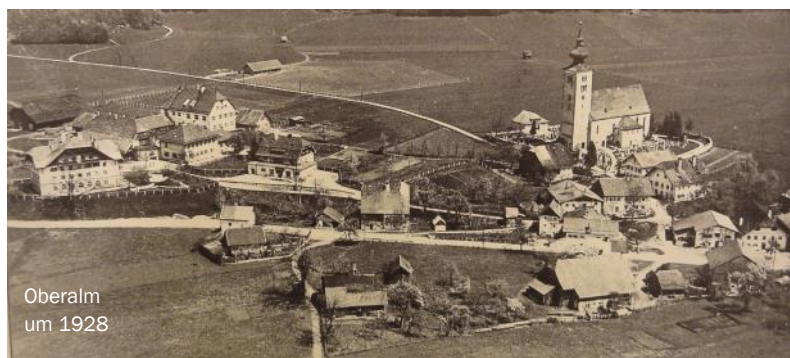
Oberalm um 1928

gesetz vom 17. März 1849 dargestellt, in dem erstmals demokratisch gewählten Vertretern des eigenen Ortes die Verwaltung übertragen wurde. Die Schaffung von Infrastruktur wie Eisenbahn, Wasser-, Strom- und Telefon- und Postversorgung; Schaffung des Schulwesens durch Bau einer eigenen Volksschule 1889 und die Errichtung der Landeslandwirtschaftsschule 1908 u.v.m wird in Wort und Bild präsentiert. Eingehend berichtet die Ausstellung von der Erhebung des Ortes zur Marktgemeinde sowie von der Feier zum tausendjährigen Bestand am 16.-17. August 1930.