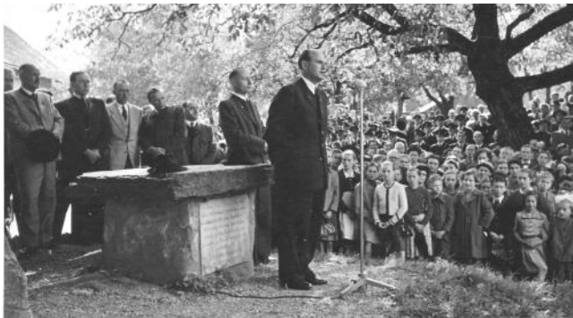
Ortswappenverleihung LH Dr. Josef Klaus

Er setzt den letzten Akt der Ausgemeindung aus Hallein und verleiht der wieder errichteten Gemeinde Oberalm erneut das Gemeindewappen mit Schranntisch und Linde, neben denen er steht.