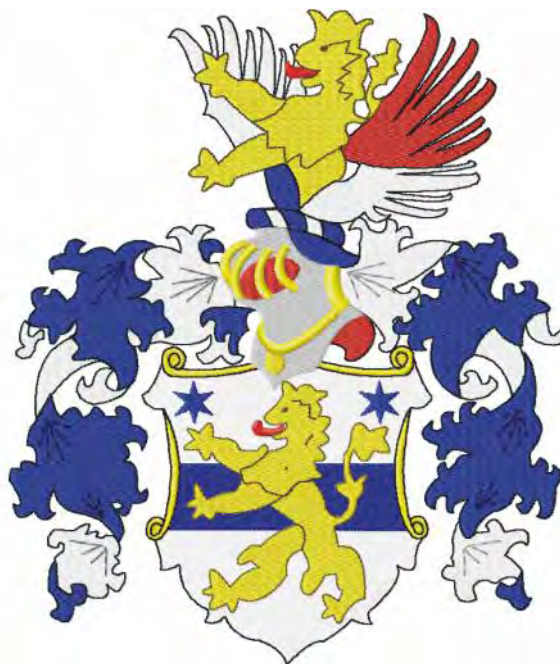
Wappen der Familie Baron von Löwenstern