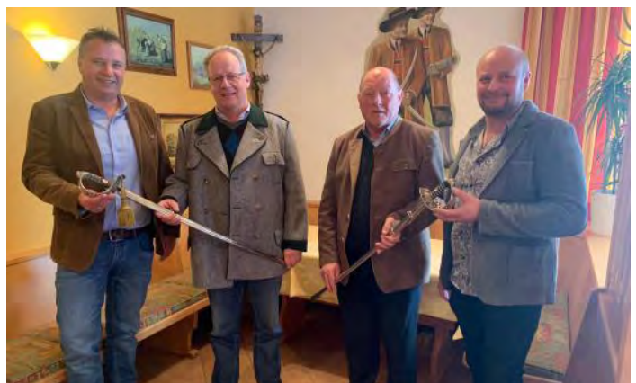
Übergabe der Säbel