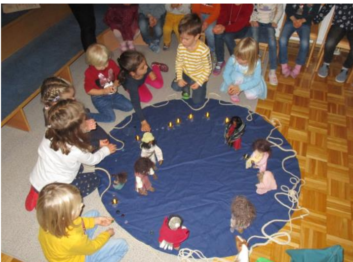
Die Geschichte des Heiligen Martin wird erzählt und dargestellt