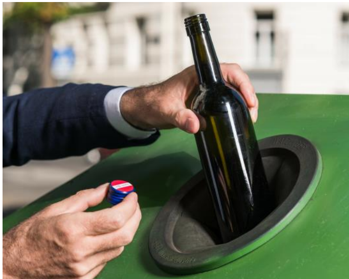
Gefärbte Weinflasche ohne Deckel zum Buntglas geben.

Die getrennte Sammlung von Glasverpackung wie Flaschen, Parfumflakons, Marmeladen- und Konservengläser wird zu Recht als wichtiger Beitrag für den Umweltschutz betrachtet. Beim Entsorgen von Altglas tauchen aber immer wieder Fragen auf: