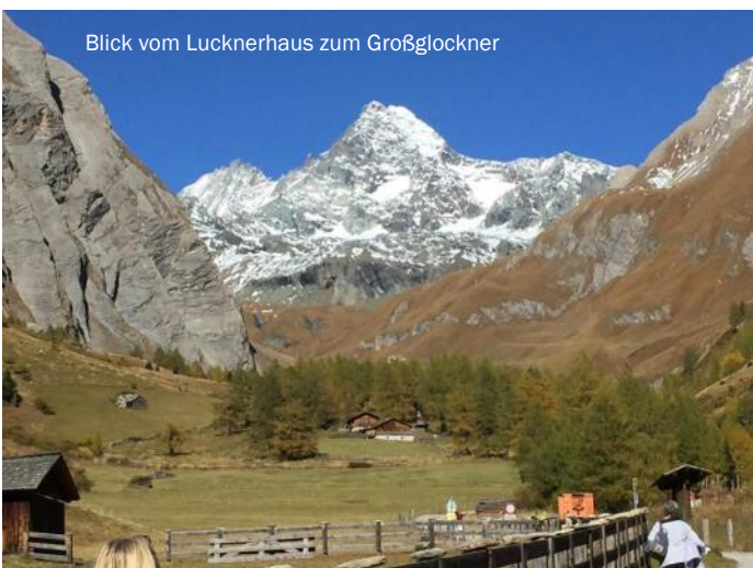
Blick vom Lucknerhaus zum Großglockner

Unsere Route führte uns auf der Hinfahrt nach Mittersill, wo wir im Nationalparkzentrum kurze Rast machten. Weiter ging es durch den Felbertauerntunnel nach Matrei über Huben nach Kals. Hier besichtigten wir das Heimatmuseum mit der Sonderausstellung „Im Banne des Großglockners“ sowie den Bergfriedhof mit den Gedenktafeln für die „Glockner