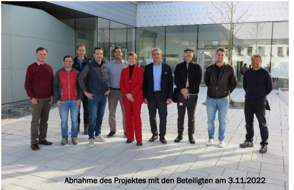
Abnahme des Projektes mit den Beteiligten am 3.11.2022