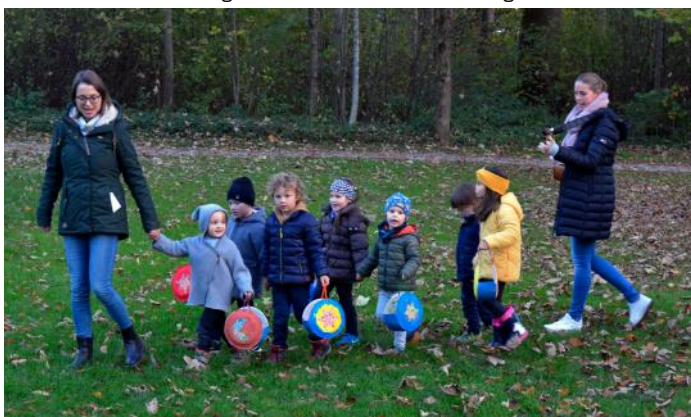
Hand in Hand ziehen wir durch den Park und folgen den Sternen