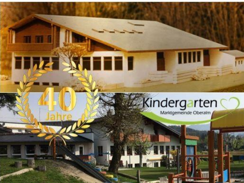
40 Jahre - Einst und jetzt