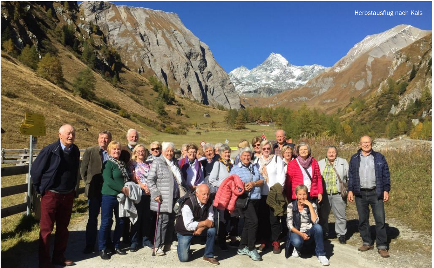
Herbstausflug nach Kals

Rückblickend auf das heurige Vereinsjahr können wir mit Stolz und Freude auf viele wunderschöne Aktivitäten und Veranstaltungen verweisen: