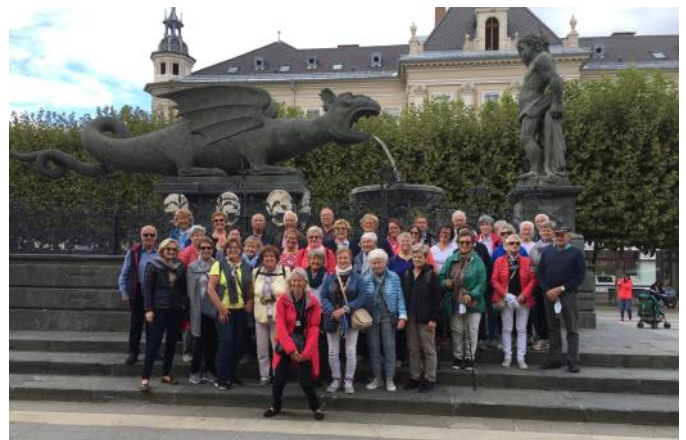
Die ganze Gruppe vor dem Lindwurm in Klagenfurt

3. Tag: An diesem Tag ging's nach Weitenfeld zur Steinerne Jungfrau und zum Gurker Dom mit der Krypta. Auf dem Magdalensberg ließen wir uns das Mittagessen schmecken und genossen die wunderschöne Aussicht. Ein Stamperl Gurktaler genossen wir beim Herzogsstuhl.