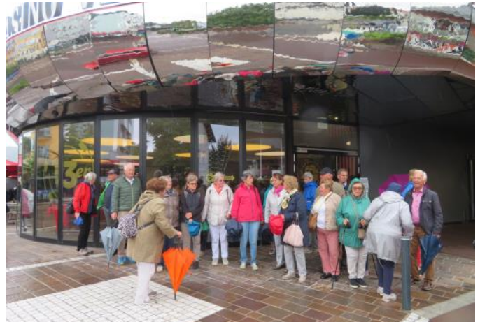
Das Casino in Velden

2. Tag: Von Klagenfurt ging es mit dem Schiff über den Wörthersee nach Velden. Hier besichtigten wir das Casino, anschließend fuhren wir weiter nach Maria Wörth und zum Pyramidenkogel. Vom Aussichtsturm aus hatte man einen grandiosen Blick über den Wörthersee. In Klagenfurt beim Stadtrundgang besuchten wir den Dom, den Wappensaal und natürlich den Lindwurm. In Kraig beim Müllers Hof ließen wir den Tag beim Abendessen ausklingen.