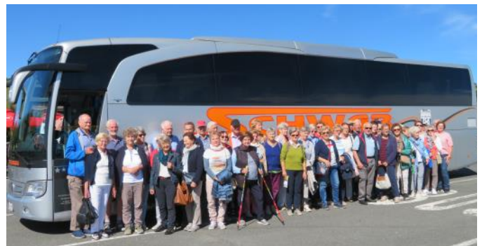
Am Dobratsch auf 1736 m