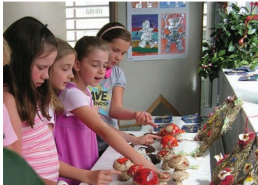
Die Kinder der VS-Oberalm haben am 9. Juni zu einer Ausstellung in das