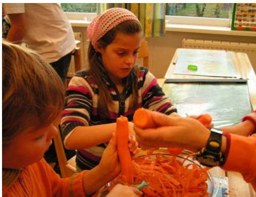
i. B.: Jeden Monat bereitet eine andere Volksschulklasse eine „Gesunde Jause“ zu.

So praktisch sie scheinen, die Fertigjause, wie Milchschnitte, Schokohörnchen, oder ähnliche Snacks, so belastend sind sie mit ihren Inhaltsstoffen für unsere Schulkinder. Die Zuckermenge kann auch bei extremer Belastung niemals voll