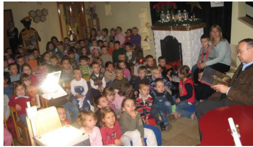
i.B.: Advent und Weihnachten im Kindergarten Oberalm