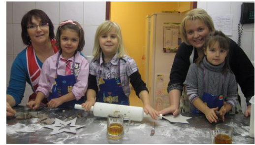
i.B.: Die Kinder backen mit den Kindergästnerinnen feine Kekse.