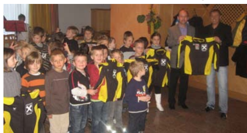
i. B.: Die neuen Trainingsanzüge gesponsert von der Raiffeisenbank.

Nach einer erfolgreichen Herbstsaison werden derzeit die Hallenlandesmeisterschaften im Fußball ausgetragen. Gute Platzierungen und tolle Spiele gab es bei den Bezirksmeisterschaften in der Halle für unsere Fußballnachwuchsmannschaften des 1. Oberalmer SV. Die Krone setzte sich jedoch die U15 Mannschaft auf, sie spielte die Vorrunde souverän und präsentierte sich in den Finalspielen bärenstark. Im Finalspiel um den Bezirksmeister gegen Union Hallein überzeugten die spiel- und laufstarken Oberalmer Jungs und gingen als verdiente Sieger vom Platz. Seit drei Jahren ist die Firma Holz-Dachbau Berger Hauptsponsor des 1. Oberalmer SV. Damit war es möglich, die