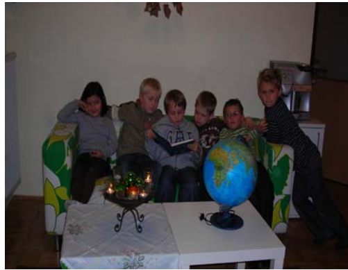
i.B.: Ein besonderer Advent im „uno“

Ein besonderer Adventkalender verkürzte den Kindern der Schulkindgruppe „uno“ die Tage vor Weihnachten. Mit dem, etwas chaotischen Rentier „Helge“ reisten die Kinder quer durch viele Länder der Welt und begegneten dabei den unterschiedlichsten Weihnachtsbräuchen und -riten. Um die dabei gesammelten Eindrücke besser verarbeiten zu können, wurde den Kindern die Möglichkeit geboten, die Länder am Globus zu suchen und eine kurze Zusammenfassung über das jeweilige Brauchtum zu schreiben. Diese kleinen Berichte wurden für alle gut ersichtlich an