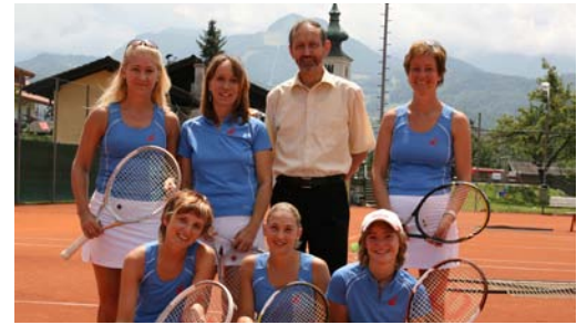
i. B.: die Spielerinnen des UTC Tennisclub Oberalm

Keine Winterpause gibt es für die Sportlerinnen und Sportler des UTC Tennisclub Oberalm. Neben regelmäßigem Training für über 30 Kinder und Jugendliche, jeden Freitag und Samstag in der Tennishalle in Hallein, sind auch die MeisterschaftsspielerInnen aktiv. Der UTC ist mit vier Mannschaften im Salzburger Winter-