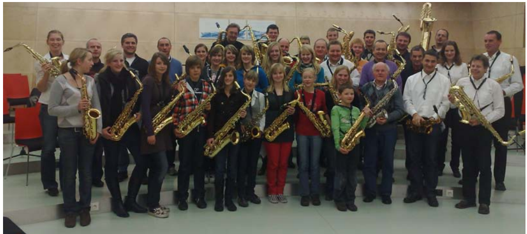
i.B. 32 SaxophonspielerInnen besuchten den Workshop im Gemeindezentrum Oberalm.