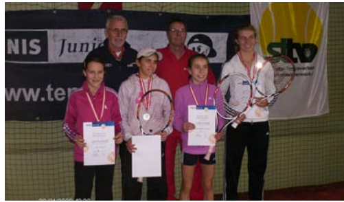
i. B.: Der UTC war beim Salzburger Wintercup wieder erfolgreich.

Keine Winterpause gibt es für die Sportlerinnen und Sportler des UTC Tennisclub Oberalm. Neben regelmäßigem Training für über 30 Kinder und Jugendliche, jeden Freitag und Samstag in der Tennishalle in Hallein, sind auch die MeisterschaftsspielerInnen aktiv. Der UTC ist mit vier Mannschaften im Salzburger Winter-