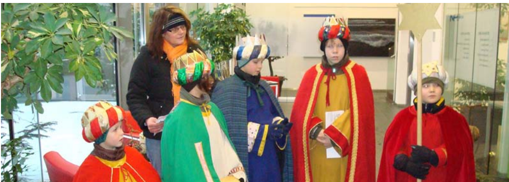
i.B. Die Heiligen Drei Könige zu Gast im Gemeindezentrum Oberalm

Egal ob kirchennah oder kirchenfern: - Jedes Jahr ist es für alle Familien wieder eine besondere Freude, wenn die „Heiligen Drei Könige“ ihre Friedens- und Segenswünsche für das kommende Jahr überbringen. „20 - C + M + B - 09“ schreiben die, als Sternsinger verkleideten Kinder, dann mit geweihter Kreide an die Eingangstür. Es bedeutet: „Christus mansionem benedicat“, übersetzt „Christus segne dieses Haus“, und soll den Bewohnern Frieden und Segen für das kommende Jahr bringen. Sternsingen ist