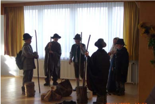
i.B.: Hirtenspieler der Volksschule Oberalm