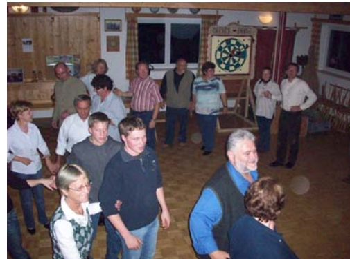
Bei dem Volkstanzkurs „Fit für Kathrein“ konnten Anfänger bis Fortgeschrittene ihre Volkstanzkenntnisse aufbessern.