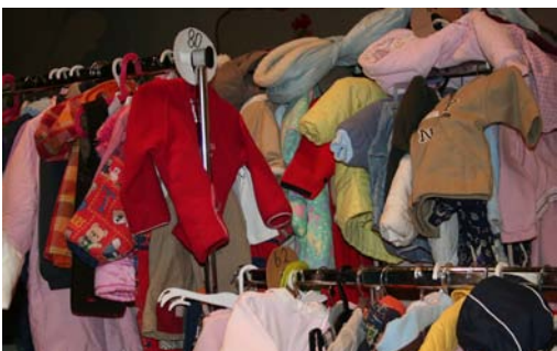
...332 Börsenbesucher wurden bei der 14. Kindersachenbörse fündig.

In der Volksschule Oberalm fand vom 14. bis 15. November 2008 wieder einmal die Kindersachenbörse statt. Dieses Mal war es bereits die vierzehnte ihrer Art. Insgesamt wurden von 208 Lieferanten 5333 Artikel abgegeben und zum Kauf angeboten. Mäntel, Jacken, Schuhe, Pullover, Hosen - alles was den Kindern zu klein geworden ist, oder einfach nicht mehr passte, wurde von den 208 Personen für die Kindersachenbörse zur Verfügung gestellt. Und auch dieses Mal war die Aktion ein voller Erfolg.