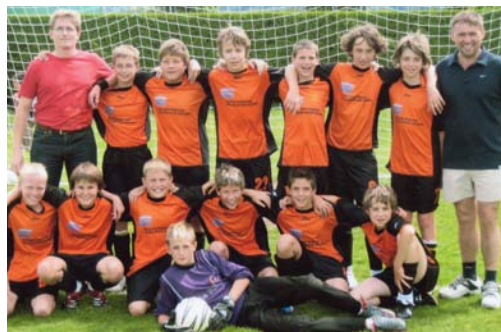
i. B.: Die Kicker des 1. Oberalmer SV

Nach einer erfolgreichen Herbstsaison werden derzeit die Hallenlandesmeisterschaften im Fußball ausgetragen. Gute Platzierungen und tolle Spiele gab es bei den Bezirksmeisterschaften in der Halle für unsere Fußballnachwuchsmannschaften des 1. Oberalmer SV. Die Krone setzte sich jedoch die U15 Mannschaft auf, sie spielte die Vorrunde souverän und präsentierte sich in den Finalspielen bärenstark. Im Finalspiel um den Bezirksmeister gegen Union Hallein überzeugten die spiel- und laufstarken Oberalmer Jungs und gingen als verdiente Sieger vom Platz. Seit drei Jahren ist die Firma Holz-Dachbau Berger Hauptsponsor des 1. Oberalmer SV. Damit war es möglich, die