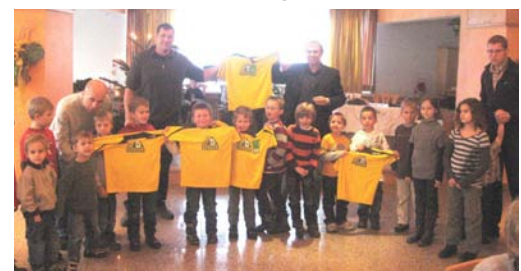
i. B.: Die kleinen Spieler mit den Dressen von Holzbau Berger.

Kampf- und die 1B Mannschaft zu konsolidieren, das Damenturnen wieder in den Verein einzugliedern und die Sektion Kegeln aufrecht zu erhalten. Der 1. Oberalmer SV bedankt sich auch bei der Firma Holz-Struber, die den Kickern im Herbst und Frühjahr den Strom für die Flutlichtanlage am Kahlspergplatz zur Verfügung stellt. Zu dem wurden die Nachwuchsspieler des 1. Oberalmer SV von der Raiffeisenbank Oberalm mit neuen Trainingsanzügen eingekleidet. Allen Sponsoren sowie der Gemeinde Oberalm ein kräftiges Dankeschön für die aktive Unterstützung unseres Vereins. Der 1. Oberalmer SV - Holzbau Berger, Sektion Fußball,